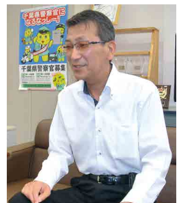
サイバー犯罪対策課の冢入課長