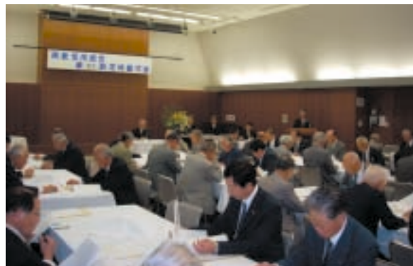
平成20年6月26日に開催された第57期定時総代会(本店6階ホール)

総代選挙規程では、選挙区、選挙期日、選挙権、選挙の公告、候補者の届出、投票の方法、当選者の通知及び公告、補充選挙等について定めています。