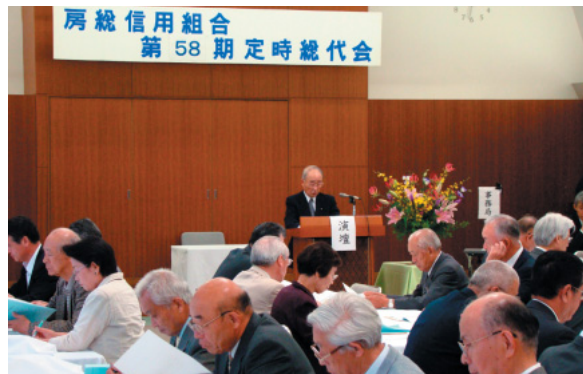
平成21年6月29日に開催された第58期定時総代会(本店6階ホール)

総代選挙規程では、選挙区、選挙期日、選挙権、選挙の公告、候補者の届出、投票の方法、当選者の通知及び公告、補充選挙等について定めています。