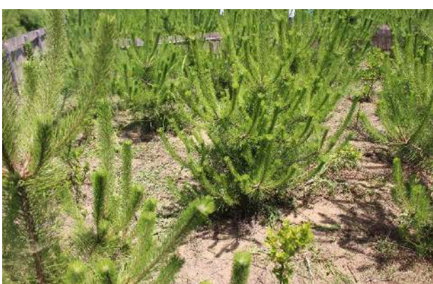
クロマツ・トベラ・マサキがすくすくと育っています。