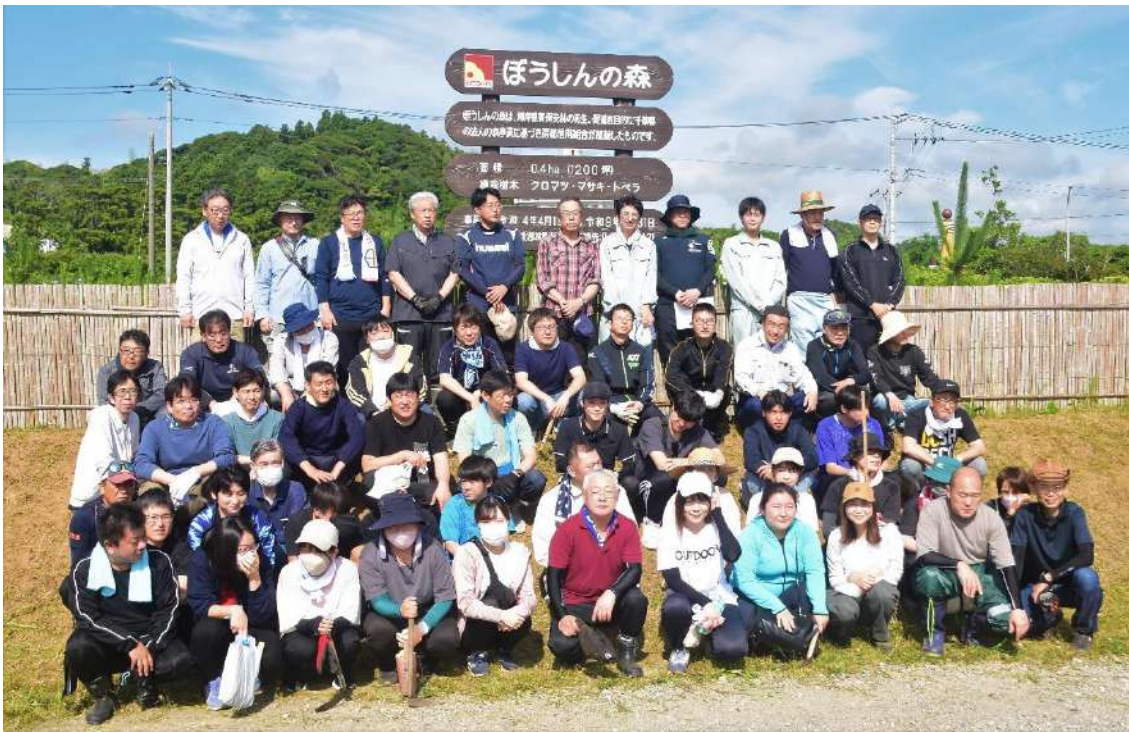
2024年6月15日下刈り時の集合写真