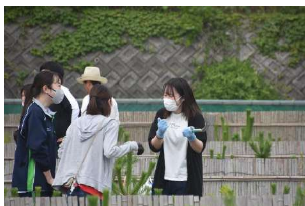
苗の育成の為下刈り等を実施